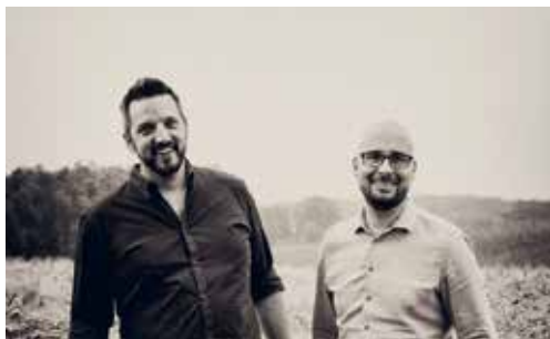
Les Poulains Flandriens